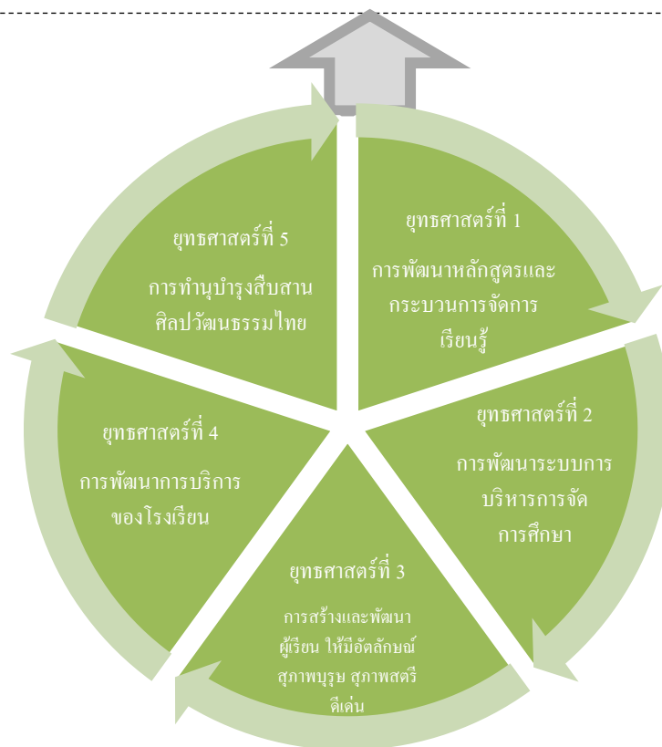
ภาพที่ ๒ ภาพแสดงยุทธศาสตร์โรงเรียนเมืองโพธิ์ชัยพิทยาคม

๕. ร้อยละ ๙๐ ของครูที่มีงานวิจัย และ/หรือนวัตกรรมด้านการศึกษาที่นำมาใช้ประโยชน์ในการพัฒนาการศึกษาของโรงเรียน